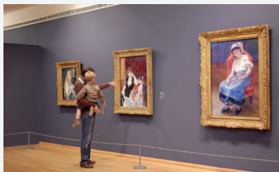
© musée des impressionnistes Giverny Visuel non contractuel.